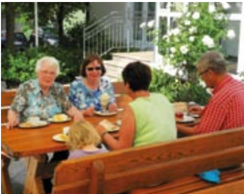
Hofgartenidylle mit Geschmack.