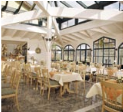
Im Frühstückspavillon die Sonne spüren.