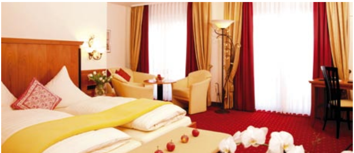
Rote Komfortsuite mit Schreibtisch, Sitzcke und viel Platz!