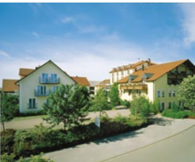
Unser Anwesen mit Stammhaus & Gästehaus. Ein paar Schritte weiter: Unser Landhaus am Dorfrand.